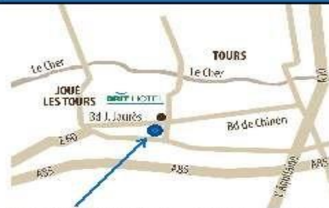
Salle Jean BIGOT et Matarazzo / rue Jean Monnet

*Tarif négocié avec le TT Joué-Lès-Tours et appliqué uniquement dans le cadre d'une réservation mentionnant ce partenariat